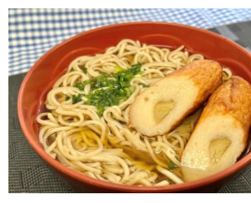
【ごぼう入りちくわ天そば】人気のおそばも塩分少なめの和風だしで!!