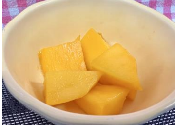
【宮崎県産完熟マンゴー】収穫時期の一番食べごろを楽しんで頂きました♪