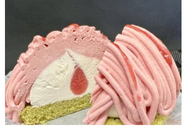
【あまおうイチゴモンブラン】抹茶スポンジケーキに生クリームとベリージャム