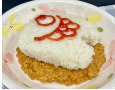
【こいのぼり仕立てのキーマカレー】こどもの日にちなんで視覚的にも★