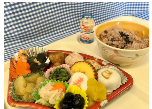
年末・年始は、恒例の年越しそば・おせち料理を用意致しました